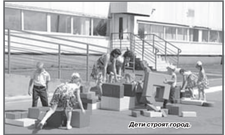
Дети строят город.