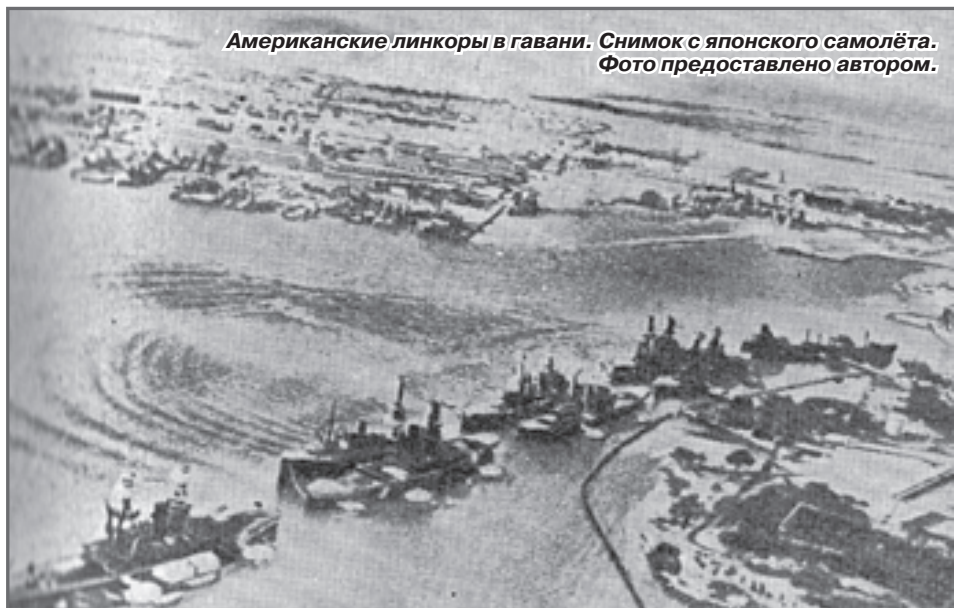
Американские линкоры в гавани. Снимок с японского самолёта.